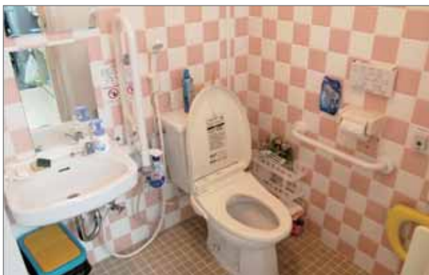
超バリアフリーストイレ

※これらの環境整備の多くは各助成を受け行われております。 改めまして感謝申し上げます。